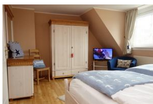
....zur Entspannung noch ein wenig fernsehen ?