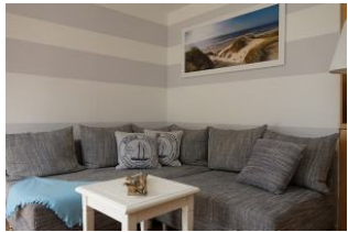
Kommen Sie herein und nehmen Sie Platz auf der gemütlichen Couch

Auf einem ca. 3000qm großen Grundstück zwischen Boldixumer Str. und Umgehungsstrasse können wir Ihnen 4 Ferienwohnungen für 2-5 Personen anbieten. Die Wohnung 3 - ein kleiner Bungalow mit ca. 33qm ist für zwei Personen eingerichtet. Wohnraum, offene Küchenzeile, Schlafzimmer und Duschbad, alles hat seinen Platz gefunden. Zudem eine herrliche Terrasse auf der Sie in der Morgensonne frühstücken können.