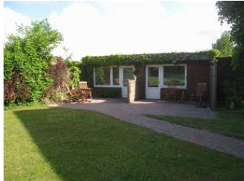
2 Bungalows bei Familie Carstensen, der rechte Eingang führt in die Wohnung 3