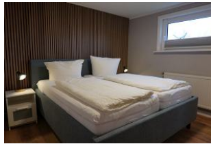
Das Schlafzimmer mit großem Doppelbett...