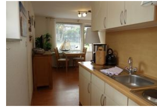
Die Küchenzeile vom Schlafzimmer aus Richtung Wohnzimmer.