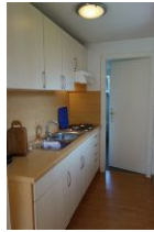
Die offene Küchenzeile, die Tür führt ins Schlafzimmer