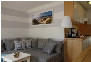
Die Couch, rechts im Bild die Küchenzeile