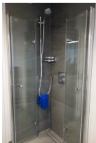
...und Dusche mit Echtglaswand, die komplett weg geklappt werden kann.