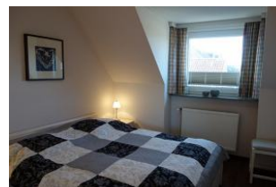
Das Schlafzimmer mit großem Doppelbett...