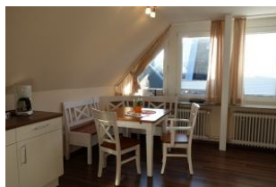
Der Essplatz an der offenen Küche