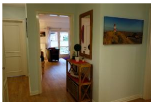
Sie befinden sich im Flur der Whg. 8 auf dem Herrenhof.