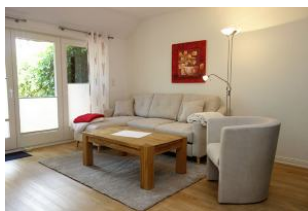
Der Blick in das großzügige Wohnzimmer...