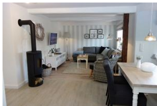
...der Blick in die gemütliche Sitzecke