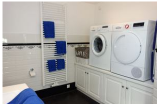
... mit Waschmaschine+Trockner zur kostenfreien Nutzung.