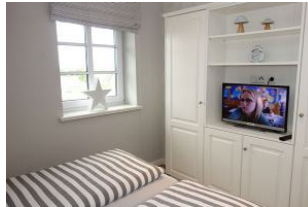
...Schrankraum und TV Gerät