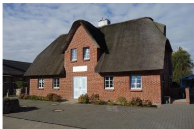
Das Doppelhaus Golfoase, Haus 1 befindet sich rechts

Die Unterkunft verteilt sich über EG und 1.OG.