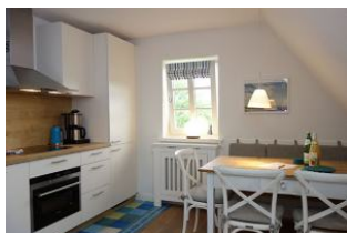
Der Esstisch mit Bank und drei Stühlen