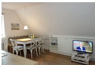
Das TV Gerät darf natürlich nicht fehlen