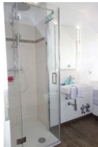
Die neue Duschkabine, flacher Einstieg