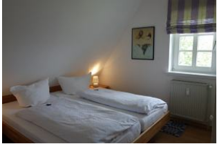
Das Schlafzimmer mit einem Doppelbett 180x200cm