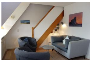
Gemütliche Sitzecke mit kleiner Couch und zwei Sesseln

Komfortable, in warmen Farben eingerichtete OG-Wohnung für 2-4 Personen. Auf halbem Weg zwischen Wyk und Nieblum steht dieses Reetdachhaus mit 4 Wohneinheiten. Wer die Ruhe sucht, den weiten Blick über Pferdekoppeln liebt, wohnt hier genau richtig. Das Meer ist so nah, man kann es fast riechen. Ideal auch für Golfer, denn der Golfplatz ist zu Fuß erreichbar.