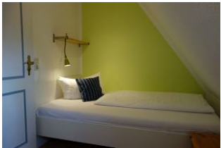
Das Kinderzimmer ist klein und gemütlich, verfügt über ein großes Bett 120x200cm