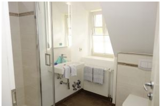
Das Bad mit Waschtisch, Dusche und Toilette