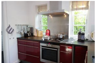
Die offene Küche mit Kochstelle E und Gas