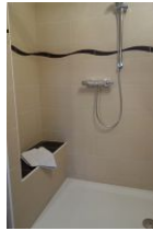
... und eine große Duschkabine, ganz flach und mit viel Ablagefläche.