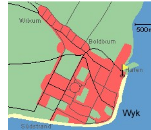
Entfernungen, zirka: zum Bäcker 30 m, zur Einkaufsmöglichkeit 350 m, zum Flugplatz 3,0 km, zum Golfplatz 3,0 km, zum Hafen 600 m, zum Meer 50 m, zum Badestrand 50 m, zum Ortszentrum 50 m