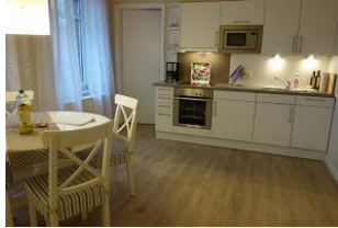
Die Küchenzeile mit Backofen und Mikrowelle...