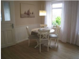
... ein wunderbarer Essplatz mit rundem Tisch...