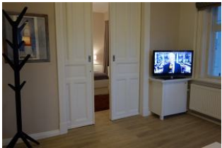
Modernes TV - Flachbild - Gerät Hinter der Schiebetür verbirgt sich...