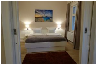
...treten Sie ein und fallen Sie ins Schlummerland !