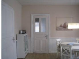
Der Blick von der Küche Richtung Wohnzimmer.