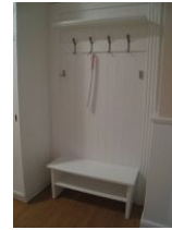
Die Garderobe vor der Wohnung - nur für Sie...