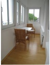
... und ein abklappbarer Tisch mit gemütlichen Korbsesseln.