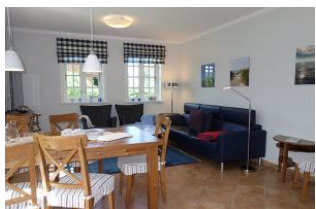
Ein Blick ins Wohn/Esszimmer - einladend....