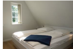
Das dritte Schlafzimmer mit Doppelbett, Bettmaß 180x200cm Verdunkelungsmöglichkeit