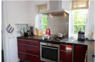
Die offene Küche mit Kochstelle E und Gas