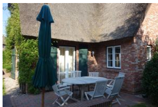
...und Terrasse 2