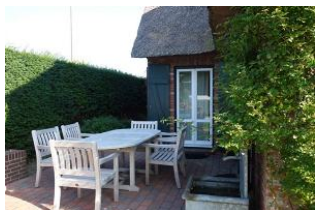
Bei bestem Wetter, Terrasse 1