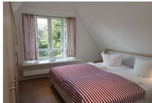
Das Elternschlafzimmer, Bettmaß 200x200cm Verdunkelungsmöglichkeit