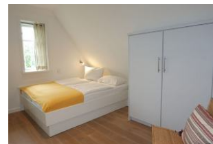
Das vierte Schlafzimmer mit Doppelbett 160x200cm (nicht im Bild: ein Schreibtisch)