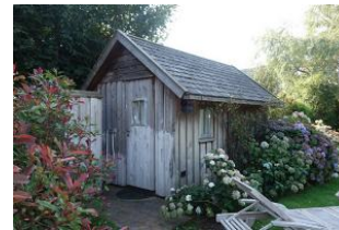
...das Saunahaus! (mit Extrakosten verbunden)