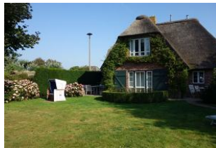
...großer Garten mit Strandkorb