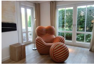
...mit einem spannenden Buch, doch Vorsicht, aus diesem Sessel mag man gar nicht mehr aufstehen...