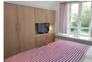
...und TV Gerät, großem Kleiderschrank