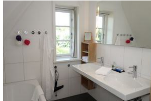
Das Bad im OG mit Doppelwaschtisch....