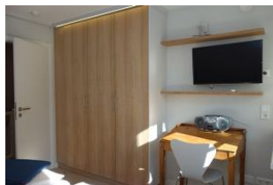
...auch hier ein TV Gerät