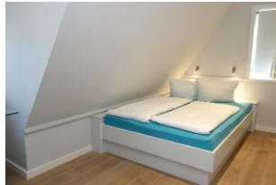
Das zweite Schlafzimmer mit Doppelbett, Bettmaß 140x200cm, Schrank + TV Gerät Verdunkelungsmöglichkeit