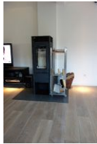
...ein gemütlicher Abend am Ofen ???