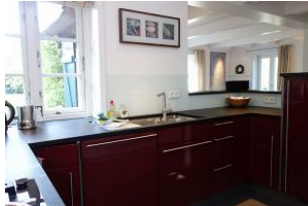
...Spüle, Kühlschrank + co