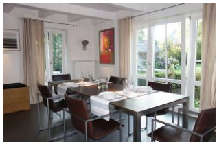
Der Tisch ist schon gedeckt ...