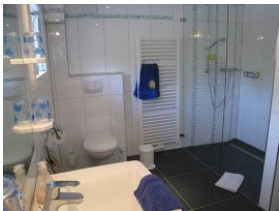
Das großzügige Duschbad im Erdgeschoss mit.....

Entfernungen, zirka: zum Bäcker 500 m, zur Einkaufsmöglichkeit 500 m, zum Flugplatz 4,0 km, zum Golfplatz 4,2 km, zum Hafen 4,0 km, zum Meer 4,0 km, zum ÖPNV 300 m, zum Badstrand 4,0 km, zum Ortszentrum 500 m