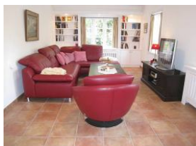
Das große Wohnzimmer...