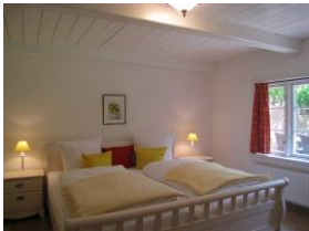
Ein Schlafzimmer mit großem Doppelbett im Erdgeschoss