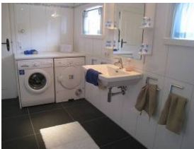
... Waschmaschine und Trockner zur kostenfreien Nutzung im Erdgeschoss