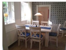
Frühstück mit Sonne - herrlich