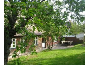
Der großzügige Garten hinter dem Haus, herrlich eingewachsen