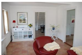
....mit gemütlichem Sessel !