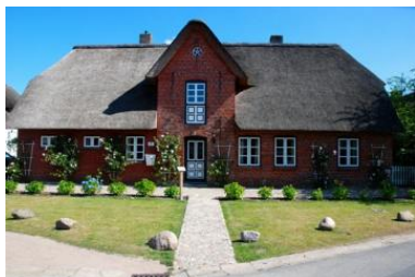
Das Ilskes Hus in Oevenum

Die Unterkunft verteilt sich über EG und 1.OG.