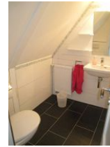
Das WC im Obergeschoss