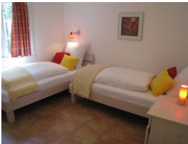
Das zweite Schlafzimmer im Erdgeschoss mit zwei Einzelbetten