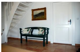
Der Eingangsbereich im Haus

Ihr Traum wird wahr. ! Das Ilskes Hus wurde komplett saniert und renoviert, teilw. neu eingedeckt und ist heute ein Ferienhaus, wie man es sich wünscht: ein altes Reetdachhaus mit modernem Komfort. Es wurde mit sehr viel Liebe zum Detail eingerichtet und verspricht Wohlgefühl. Große, freundliche Räume bieten einer sechs - köpfigen Familie Raum für einen gelungenen Urlaub. Treten Sie ein und lassen sich verzaubern..... Um dem Klimagedanken zu folgen, verfügt das Ilkes Hus auch über eine Ladestation für E-Autos (ABL eMH1)