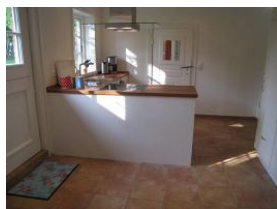
Hier von der anderen Seite zu sehen. Die Tür im Hintergrund führt ins Esszimmer