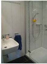
Das Duschbad im Obergeschoss