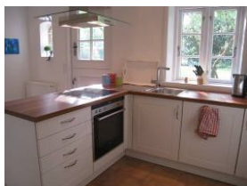
Die sep. Küche mit Winkelzeile