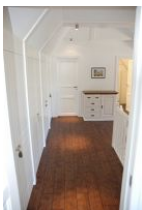
Der Flurbereich im Obergeschoß