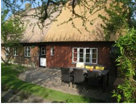
Die Terrasse hinter dem Haus - völlig ungestört