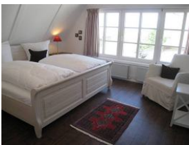
Das Schlafzimmer mit Blick in die Marsch im Obergeschoss