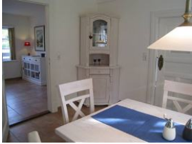
Vom Esszimmer kann man auch ins Wohnzimmer gehen.