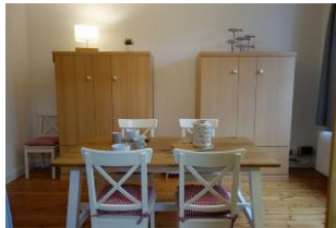
...hier die beiden Schrankbetten von denen jede Matratze 110cm in der Breite misst. Tisch beiseite geschoben und fertig ist das zweite Schlafzimmer.