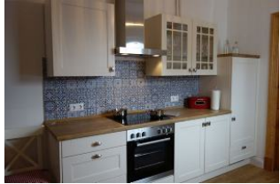
...die linke Küchenzeile beherbergt Ceranfeld/Backofen und den Kühlschrank...