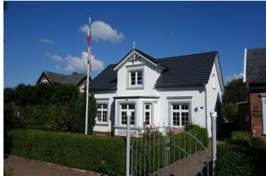
Villa Hansson, Boldixumer Str. 14 in Wyk auf Föhr