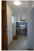
Der Durchgang zum Hintereingang und zur...