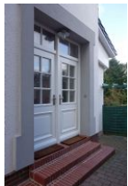
...die linke Haustür führt in die Wohnung 1

Die Villa Hansson - altes Haus in neuem Glanz. mit ganz besonderem Charme. Moderner Scandi Look in großen, hellen und hohen Räumen macht gleich gute Laune. Wohnzimmer, Küche, Duschbad alles hell und freundlich in weiß und hellen Holzönen eingerichtet. Großenteils konnten die alten Zimmertüren erhalten werden. Herrlich diese Mischung aus alt und neu. Das Haus ist zentral gelegen, Einkaufsmöglichkeiten beim Edeka Knudtsen direkt gegenüber.