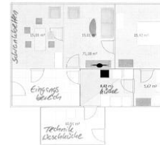
Grundriss der Wohnung 1 im EG der Villa Hansson