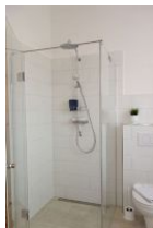
... großer, ebenerdiger Dusche.