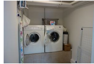
...Waschmaschine und Trockner, kostenfrei zu nutzen. Bitte Zwischentür abschließen, die Gäste aus dem Obergeschoß dürfen die Maschinen auch nutzen.