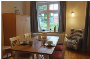
...ein sep. Esszimmer findet man selten, auch gut als Leserückzugsort geeignet...