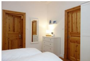
...Kommode und Ganzkörperspiegel...