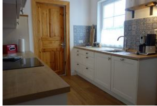
...die rechte Küchenzeile die Spüle, Kaffeemaschine und vieles mehr...