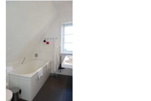
...Badewanne und Dusche, Toilette (nicht im Bild)