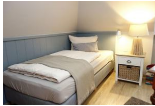
...links ein Bett...