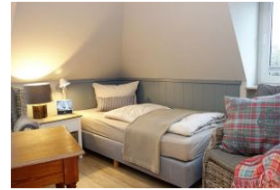
...rechts ein Bett...