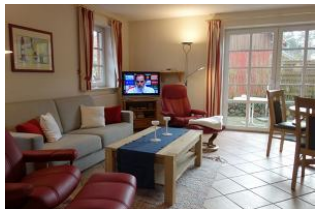
... und der zweite gemütliche Sessel.