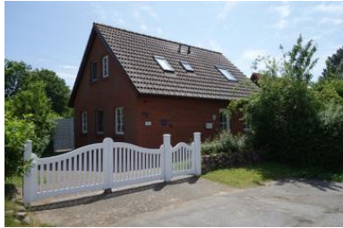
Das Haus Dithmarschen im Susanne-Fischer-Weg 1b