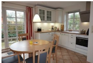
...die neue Küche (Feb 2024)