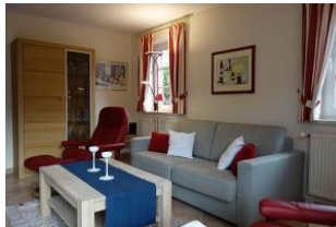
Couch und toller Stressless Sessel mit Fusshocker