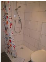
...und flacher Duschwanne.