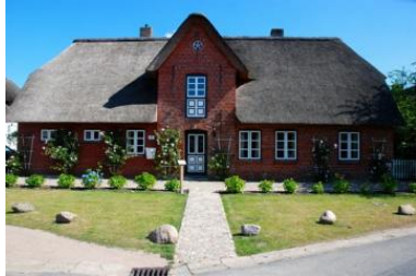
Das Ilskes Hus in Oevenum

Die Unterkunft verteilt sich über EG und 1.OG.