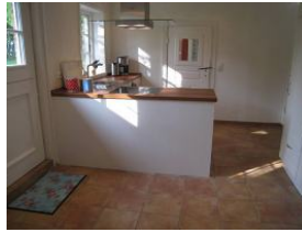
Hier von der anderen Seite zu sehen. Die Tür im Hintergrund führt ins Esszimmer