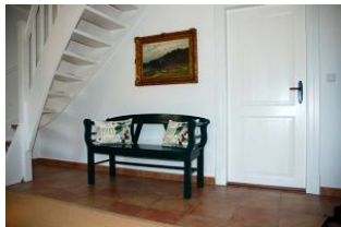
Der Eingangsbereich im Haus

Ihr Traum wird wahr. ! Das Ilskes Hus wurde komplett saniert und renoviert, teilw. neu eingedeckt und ist heute ein Ferienhaus, wie man es sich wünscht: ein altes Reetdachhaus mit modernem Komfort. Es wurde mit sehr viel Liebe zum Detail eingerichtet und verspricht Wohlgefühl. Große, freundliche Räume bieten einer sechs - köpfigen Familie Raum für einen gelungenen Urlaub. Treten Sie ein und lassen sich verzaubern..... Um dem Klimagedanken zu folgen, verfügt das Ilkes Hus auch über eine Ladestation für E-Autos (ABL eMH1)