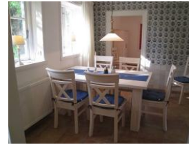
Frühstück mit Sonne - herrlich