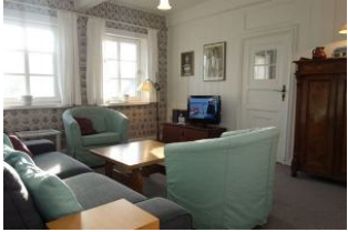
Der alte Schrank und die alte Truhe passen wunderbar zu den Delfter Kacheln.