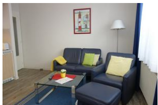
Couch und Sessel laden zu gemütlichen Stunden ein.