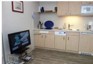
Die offene Küchenzeile