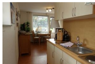
Die Küchenzeile vom Schlafzimmer aus Richtung Wohnzimmer.