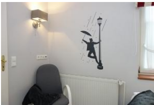
The Raining Man - der gute-Laune-Mann !