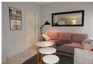
...hier noch einmal die Couch, die Tür führt zum Schlaftrakt.