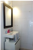
Handwaschbecken und großer Spiegel, gute Beleuchtung