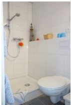
Die Dusche und Toilette, nicht im Bild das Handwaschbecken.