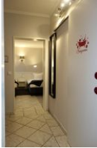
...vom Wohnzimmer am Bad vorbei ins Schlafzimmer !

Zwei Garderoben und ein Stuhl bieten genügend Möglichkeiten Kleidung auszulüften