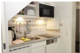
Die kleine Küchenzeile mit Geschirrspüler und Mikrowelle

Ruhig gelegen, inmitten unseres kleinen Städtchens Wyk finden Sie unser Haus Hallig Hooge, welches insgesamt 7 Wohnungen für jeweils zwei Personen beherbergt. Das Appartement Langeneß ist größer als die anderen Erdgeschossappartements und bietet daher ein wenig mehr Freiraum. In dem großzügigen Wohnraum mit Essplatz, der kleinen Einbauküche, dem Schlafzimmer mit Einzelbetten, und dem Duschbad kann man auch einen längeren Aufenthalt genießen, ohne sich eingeeengt zu fühlen. Ein großer Kleiderschrank im Flur vor dem Schlafzimmer bietet genügend Platz für Garderobe.