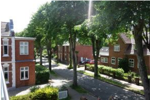
Der Blick entlang der Feldstr. zum Mühlenpark