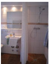
Das moderne Duschbad und .....