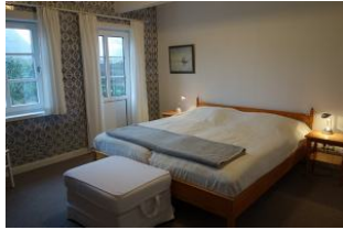
Das Elternschlafzimmer, auch hier die Delfter Kacheln....