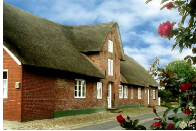
Das Haus "Welkimen tūs" in Oldsum Eingang zur Wohnung "Tradition"