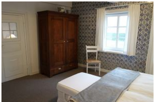
Ein wunderschöner Kleiderschrank.