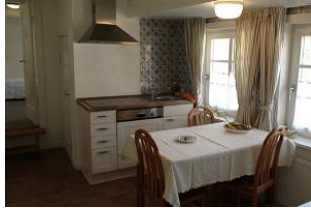
Ein Teil der neuen, modernen Einbauküche