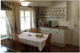
Der andere Teil.....

Entfernungen, zirka: zum Bäcker 50 m, zur Einkaufsmöglichkeit 50 m, zum Flugplatz 8,0 km, zum Golfplatz 8,0 km, zum Hafen 8,0 km, zum Meer 1,0 km, zum Badestrand 3,0 km, zum Ortszentrum 50 m