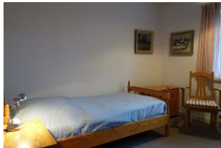
Ein Schlafzimmer mit Einzelbett