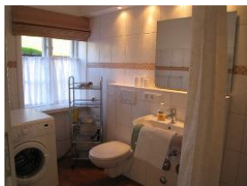
... die Waschmaschine