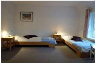
Das dritte Schlafzimmer mit zwei Einzelbetten