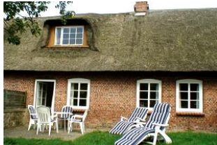
Die Terrasse mit gemütlichen Gartenmöbeln hinter dem Haus