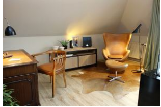
...für die Entspannung mit Musik und einem guten Buch? Rechts vom Sessel befindet sich die Balkontür.