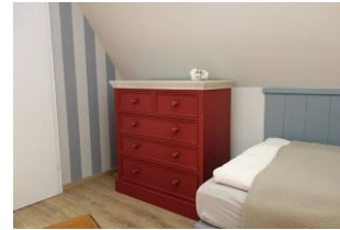
zus. zum Schrank noch eine große Kommode.