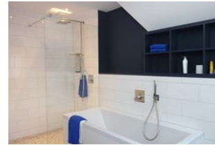
...mit Badewanne und großzügiger, bodengleicher Dusche