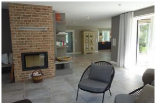
Der Blick Richtung Küche...