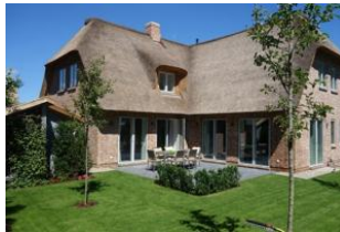
Die herrliche Terrasse. Hier dürfen Sie den Tag beginnen.....