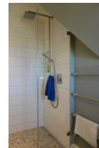
...mit großzügiger, bodengleicher Dusche