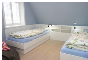
Zwei Einzelbetten (je 90x200cm) im Kinderzimmer