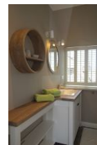
...und das dritte Bad...