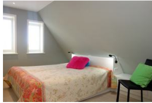
Das zweite Schlafzimmer. ebenfalls mit großem Doppelbett 180x200cm ohne Fussteil (nicht im Bild, das TV Gerät)