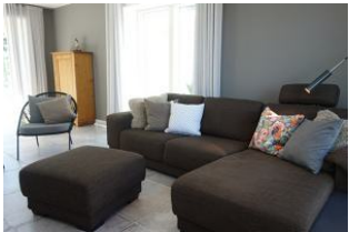
die Couchecke für lange Klönabende ....