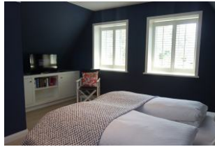
Einbaukommode und TV Gerät