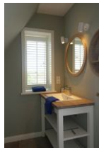
Das kleine, aber feine dazugehörige Bad, ebenfalls vom Schlafzimmer aus zu begehen