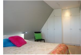
...und großem Einbauschrack.