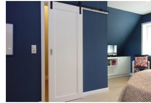
...und begehbarem Kleiderschrank.