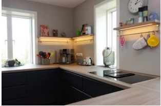
...benutzerfreundlich mit Schubladen.