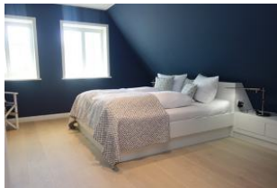
Das Elternschlafzimmer mit Doppelbett 180x200 cm ohne Fussteil