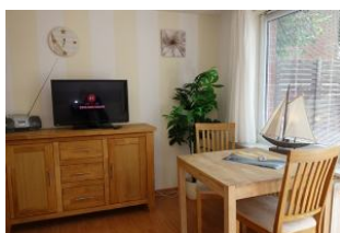
Der Esstisch mit Blick in den Garten. Das TV Gerät