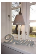
I had a dream.....