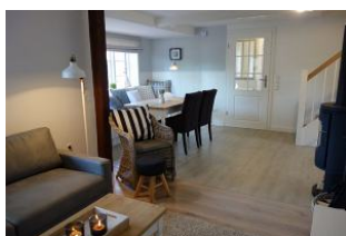
Blick vom Wohnzimmer zum Eingangsbereich