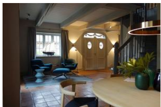
Der Blick zur Haustür

Dieses traumhafte Hausteil wurde im Frühjahr 2020 komplett saniert und neu eingerichtet. Seien Sie gespannt auf ein großzügiges Erdgeschoß mit offenen Räumen ohne störende Türen (friesischer Rundgang), tolles Ambiente, moderne Einrichtung, technische Raffinessen (5x Sonos Box) Küchenschränke mit Touchfunktion, Vollflächiger Induktionsherd, Sauna im Bad im OG, zwei Schlafzimmer mit großen Doppelbetten, eins mit zweitem TV Gerät. Durch dies Haus muß man einmal durchgehen, alles ausprobieren, sich setzen und auf sich wirken lassen. Toll, seien Sie gespannt auf dieses 5 Sterne Haus !