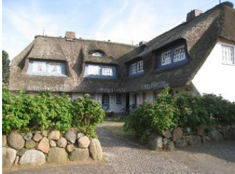
Das Eckhus im Hochstieg 22

Die Unterkunft verteilt sich über EG, 1.OG und DG.