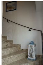
Das Treppenhaus führt zu beiden Wohnungen