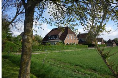
Das Haus Hardesweg 9