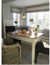
...der kleine Essplatz.....