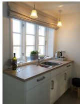
Ein Teil der Küchenzeile.