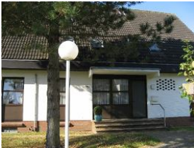
Die Haustür des Hauses Gmelinstr. 28 Haus 5