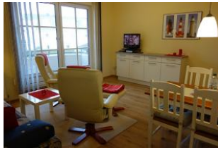
Zwei Relaxsessel zum Fernsehen, entspannen, lesen ....