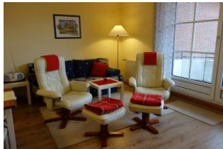
Das neue Wohnzimmer mit Laminatboden.

Sie suchen Entspannung ? Relaxsessel heißt das Zauberwort. Diese bieten wir Ihnen in einer gepflegten Zwei - Zimmer - Wohnung unweit vom Wyker Südstrand an. Die kleine Küche und das Wohnzimmer mit Austritt auf den Balkon sind komfortabel ausgestattet. Das Duschbad verfügt über eine hohe Duschwanne. Das Schlafzimmer mit großem Doppelbett ist gemütlich eingerichtet.