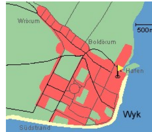
Entfernungen, zirka: zum Bäcker 30 m, zur Einkaufsmöglichkeit 350 m, zum Flugplatz 3,0 km, zum Golfplatz 3,0 km, zum Hafen 600 m, zum Meer 50 m, zum Badstrand 50 m, zum Ortszentrum 50 m