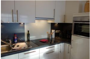
Die offene Küchenzeile