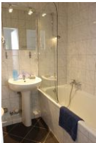
Und das Wannenbad - auch zum Duschen geeignet, nicht im Bild: die Toilette