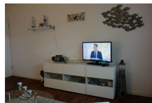
...für einen TV - Abend ?