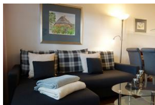
...ein gemütliches Plätzchen...