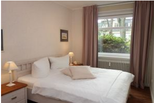
Das Schlafzimmer, Bettmaß 180x200cm kein Fußteil. Verdunkelungsmöglichkeit.