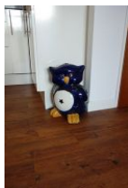
...die Namensgeberin der Wohnung: die Eule

Klein - aber mein, könnte man zum Eulennest sagen. Diese geschmackvoll eingerichtete Wohnung - im Herbst 2013 komplett renoviert und neu eingerichtet - bietet zwei Personen Platz für einen erholsamen Urlaub. Das Wohnzimmer mit offener Küchenzeile, Austritt auf die Terrasse, das sep. Schlafzimmer, das Wannenbad mit Duschabtrennung bieten genügend Raum. Mitten in der Stadt, unweit des Storchensparks und nur wenige Gehminuten zum Strand, eine komfortable Wohnung zu ebener Erde - was braucht es noch zur guten Erholung ?