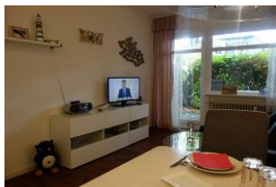
Der Blick zur Terrasse