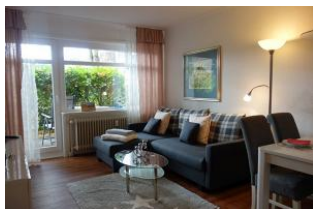
Das Wohnzimmer, mit gemütlicher Couch in modernen Farben...