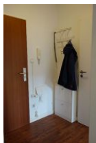
Der kleine Flur mit Garderobe und Schuhschrank