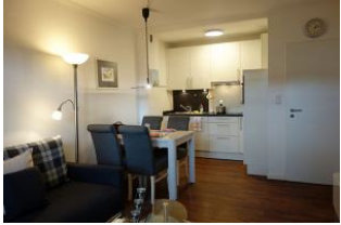
Der Essplatz als Insel zwischen Küche und Wohnzimmer