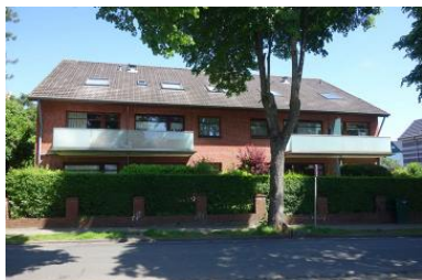
Die Aussenansicht des Hauses Feldstr. 18 in Wyk