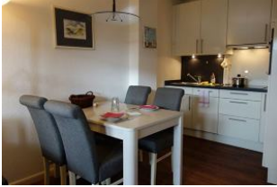
...hier noch einmal der Esstisch