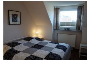
Das Schlafzimmer mit großem Doppelbett...