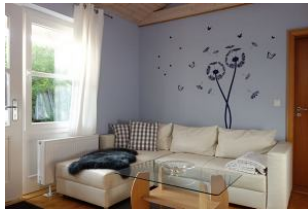
....nehmen Sie Platz.....