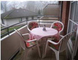
Und der herrliche Balkon.....