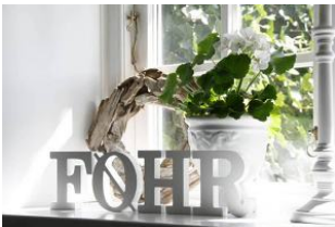
F O E H R