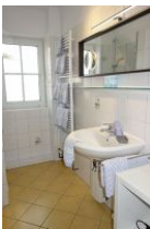
Das Bad mit...