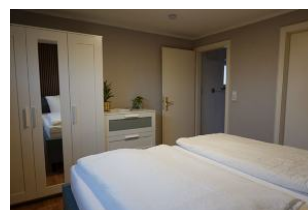
...genügend Platz für Kofferinhalte