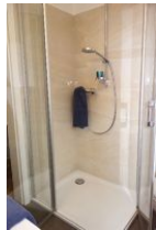
...die Dusche mit flachem Einstieg