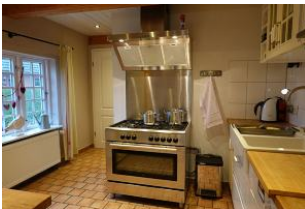
...ein Kinderspiel bei einem solchen Gasherd....