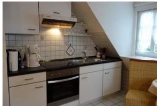
Hier noch einmal aus der Nähe...