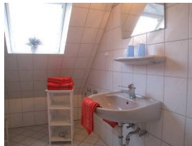
Das Badezimmer mit ...