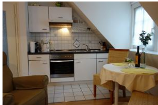
Die offene Küchenzeile mit kleinem Essplatz.

Zentralgelegenes Ein-Raum-Appartement in der Mühlenstrasse für den kleinen Geldbeutel. Wer "mitten drin" wohnen will, keinen Wert auf eine große Wohnung legt, viel unterwegs sein möchte und nur "ein Bett zum schlafen" benötigt, bucht hier genau richtig.