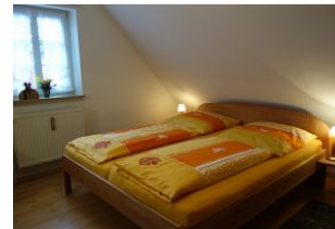
Ein großes Doppelbett für die Nachtruhe.