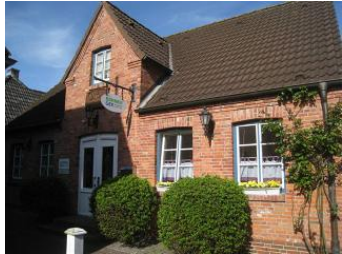
Das Haus in der Mühlenstr. 2 Die Wohnung befindet sich im 1.OG