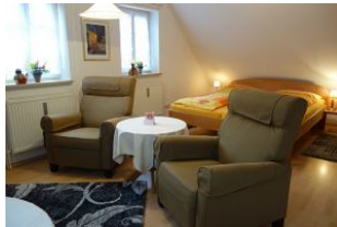
Zwei einladende Sessel für einen ausgedehnten TV - Abend.