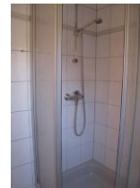
... Duschkabine; nicht im Bild: das WC