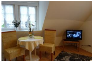
...direkt davor der Essplatz