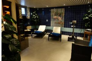
Der Fitnessbereich im Untergeschoß mit ...