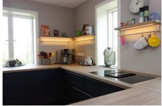
...benutzerfreundlich mit Schubladen.