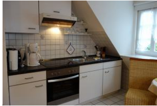
Hier noch einmal aus der Nähe...